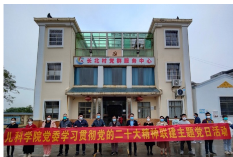
儿科学院党委学习贯彻党的二十大精神联建主题党日活动

共建单位成员交流学习党的二十大精神体会，一致认为乘着海南自贸港蓬勃兴起的东风，围绕建设宜居宜和美乡村要求，以忠诚干净担当的实际行动践行入党誓言，充分调动党员干部积极性，今后在村民医疗服务、学院教学保障上充分发挥组织联建和发展联动的作用，资源互补，共商共享，扎实做好乡村振兴和儿科学院协同发展工作。