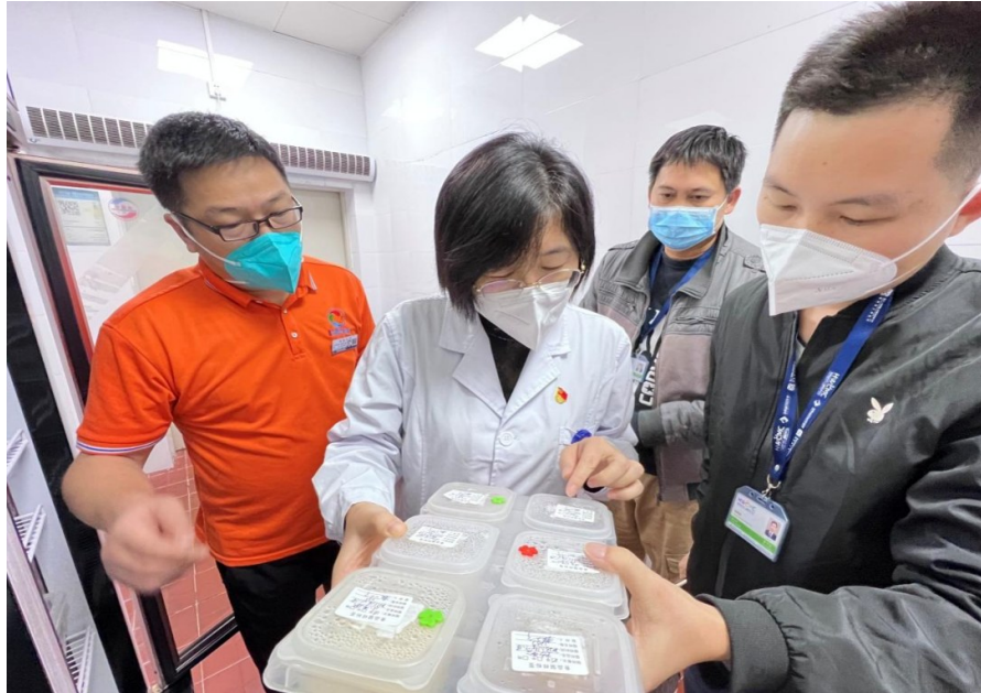
院领导检查长滨路院区食品卫生

检查组分为医疗质控、护理院感、保障后勤三个小组,院领导各带一组,各组深入院区内各重点部位开展检查。一是抽查医护人员及后勤人员对消防安全“四个能力”、“四懂四会”以及消防设施的掌握情况。二是对危化品的管理、储存以及废弃化学品实验室的设备进行了检查。三是对医疗废物的管理、处置流程进行了检查。四是对消防