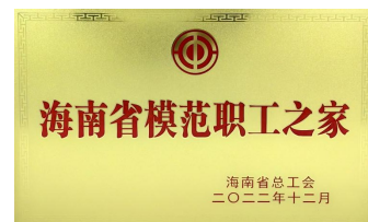
中心工会委员会荣获海南省模范职工之家。