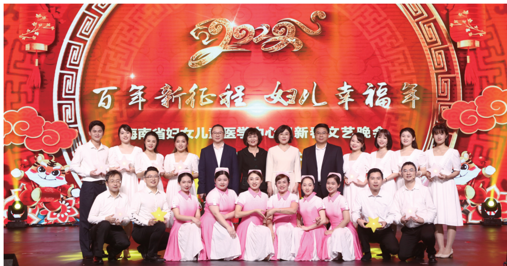
举办新春文艺晚会。

中心始终坚持员工福利与事业发展同步的理念,制定能够体现医务人员劳动技术价值的薪酬制度和员工关爱和权益保障制度;长期以来形成了“艰苦奋斗、精研业务、勇于创新、爱院如家、医患扶助”的良好文化氛围,打造了独具特色的几大文化品牌。如开展了文化艺术节文艺晚会、“相亲相爱一家人·欢欢乐乐过新